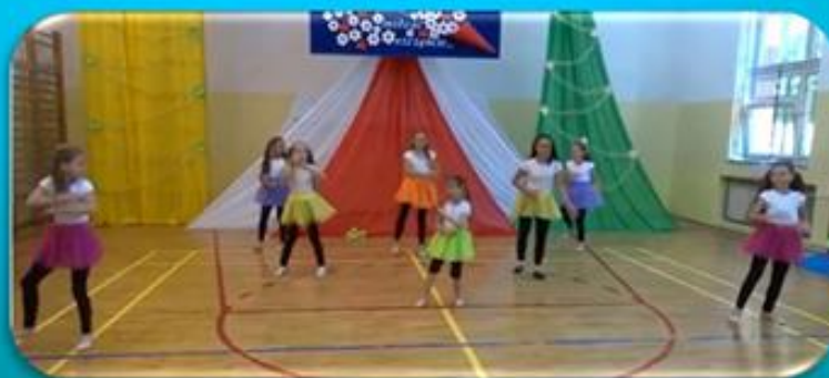
pokaz taneczny grupy „Image Dance” kl. V – VII