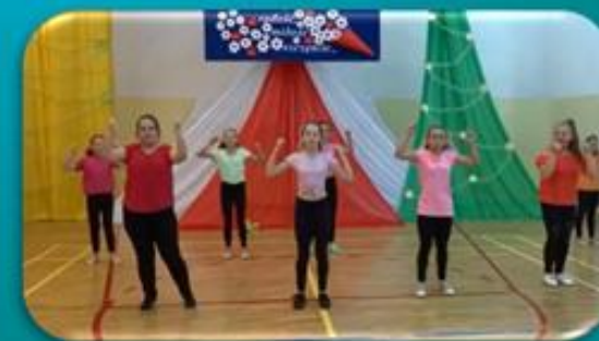
układ taneczny „Sofia” kl. IV i VI