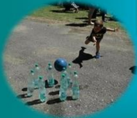
rodzinne rozgrywki sportowe