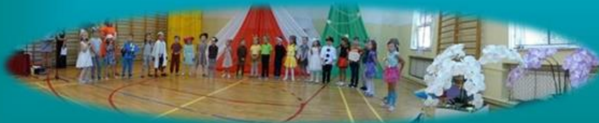
występ muzyczny kl. 0 w „4 porach roku dla Mamy i Taty”