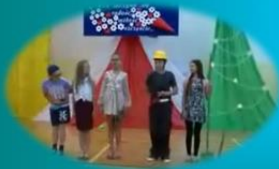
siecz pt. „Superniania”