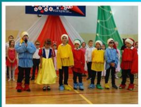
„Bajkowy koncert życzeń” klas I - III

Goście obejrzeni bogaty program artystyczny.