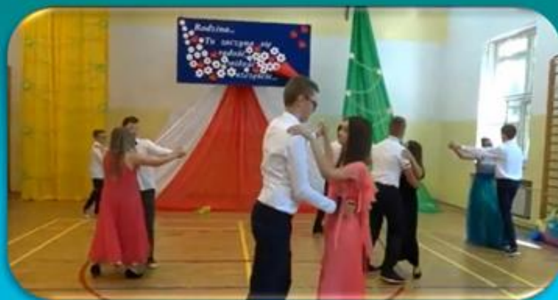
tańce klasyczne uczniów kl. V – VII