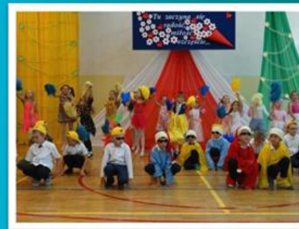
Smerfny rap kl. I - III