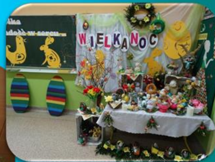
I miejsce – kl. II SP