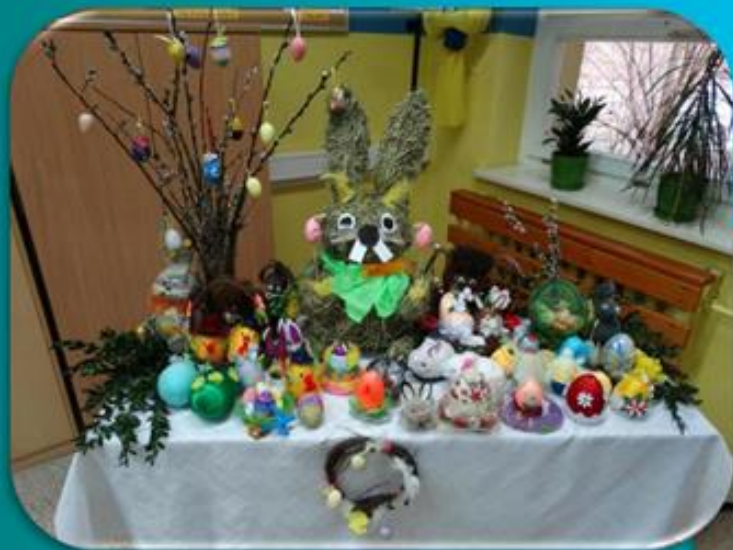
I miejsce – kl. V SP