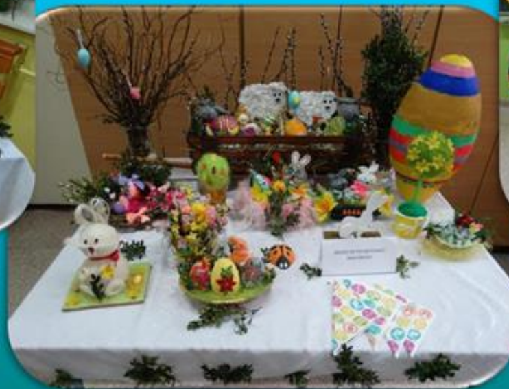
I miejsce – kl. VII SP